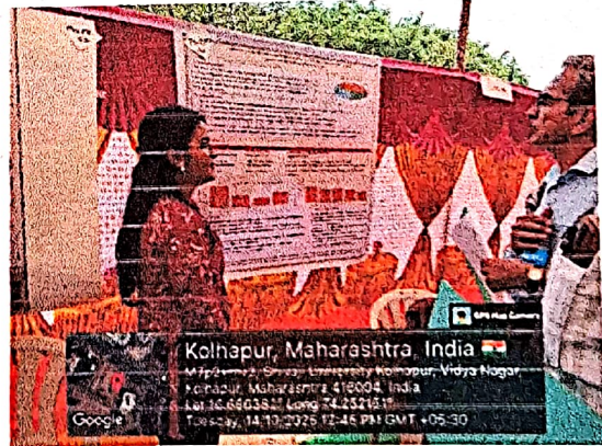
मा.परीक्षकांसमोर विषय सादर करताना विद्यार्थिनी