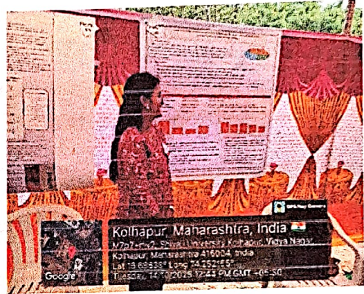
स्पर्धेत सहभागी विद्यार्थिनी